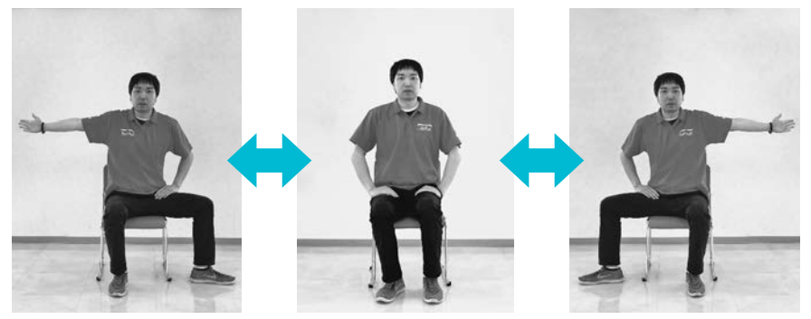
①1.2.3.4で右手と左足を外に出す ②5.6.7.8で元に戻す ③反対も同様に