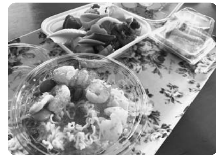
子ども食堂 3月のお弁当

どんぐり保育園では、感染症対策に気を配りながら、子どもたちの成長を日々、見守っています。誰もが1年に1度、主役になる日「お誕生会」では、歌や遊びを交えながら、楽しくお祝いしています。