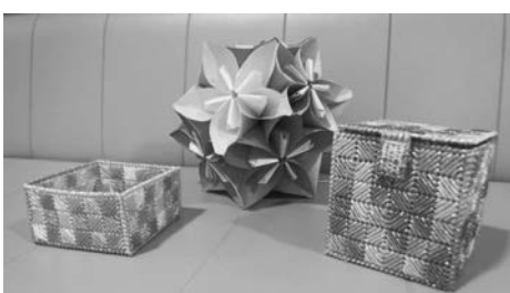
メタリックヤーン細工/写真①