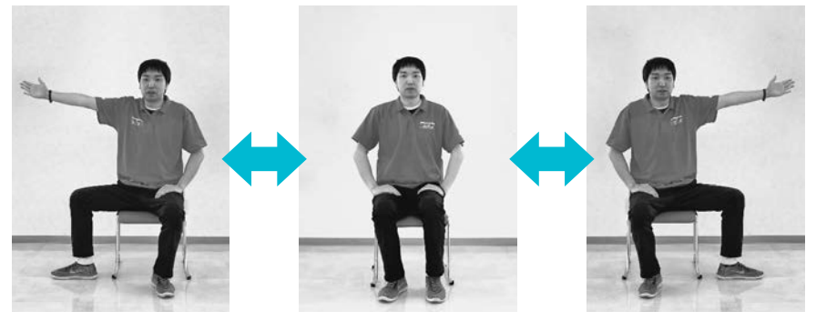
①1.2.3.4で右手と右足を外に出す ②5.6.7.8で元に戻す ③反対も同様に