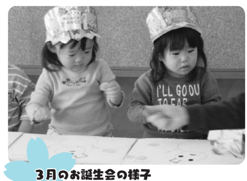
3月のお誕生会の様子