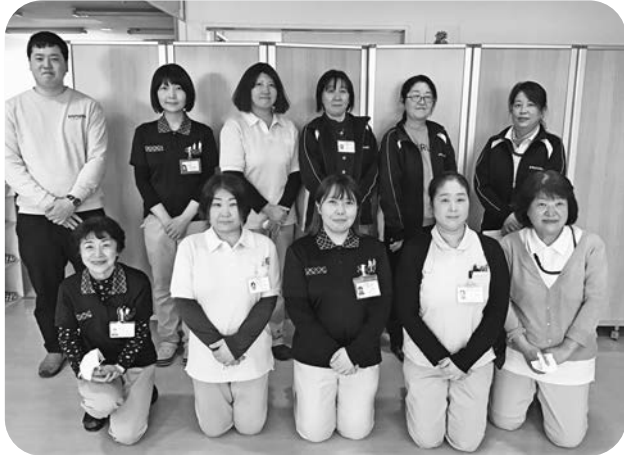
にじの家 スタッフ (撮影のためマスクを外しています)