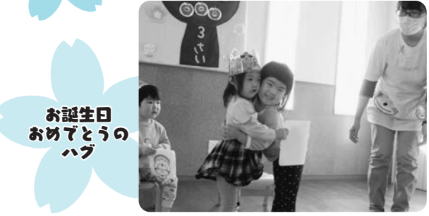
お誕生日おめでとうのハグ