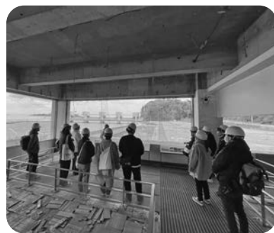
震災遺構 気仙中学校

3月2日から3日にかけて、入職2年目研修(岩手民医連主催)が行われ、陸前高田市でのフィールドワークや、岩手民医連が行った災害支援について学びました。こ