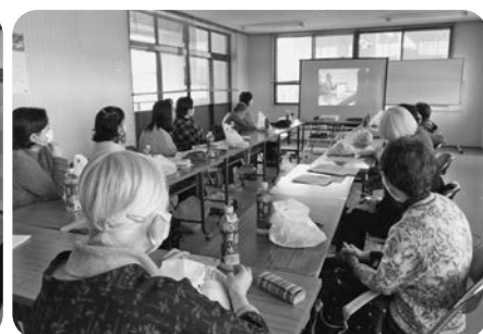
厨川・みたけ支部