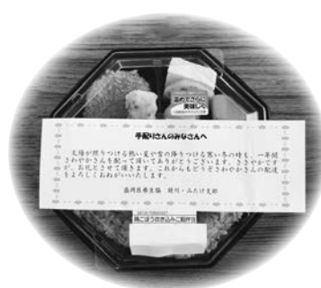
お弁当に添えられた手紙

地域で「さわやかさん」を配布してくれる手配りさんがいることで、医療生協の事業や組合員活動を皆さんにお知らせすることが出来ます。ぜひ、みなさんも手配りさんになってみませんか。