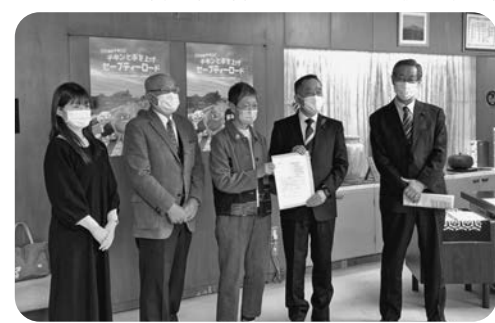
子どもの医療費の請願提出

しました。また、「いわての介護を良くする会」は、同じく12月岩手県議会に介護保険制度の改善を求める請願を提出しました。2024年4月に予定されている介護保険制度改定案に反対し、利用料の引き上げ、要介護1、2の生活援助