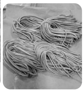
出来あがったそば

が、自分で打ったそばで年越しを迎えるために、毎年の企画にしようと思っています。他の支部や班でも、そば打ち体験をして、感動と楽しさを味わってみませんか。