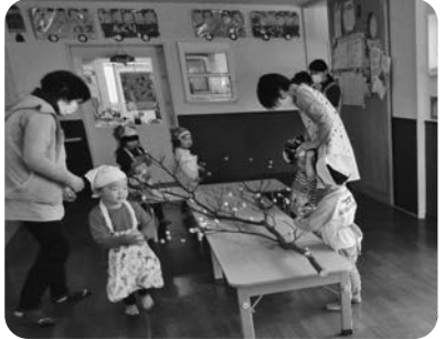
団子の花が咲きました

1月12日ちよっぴり早めの小正月行事を行いました。みずき団子作りから枝刺し、絵馬にお願いごとを書いて、みんなで披露しました。前日に団子を作って準備します。みずき団子の4色は、ピンクは春、みどりは夏、黄色は秋、白は冬を表