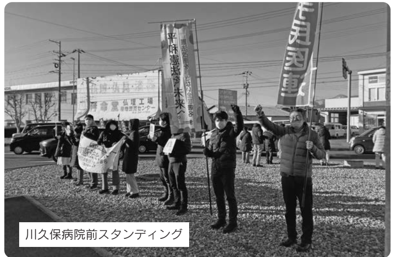
川久保病院前スタンディング

ロシアのウクライナ侵略が始まっておよそ1年、多くの命が失われ建物が破壊されている惨状に心が痛みます。ウクライナの戦争は他人事ではありません。日本はかつてのつらい経験の中で憲法をつくり戦争を防いで来ました。憲法9条の精神を広げ、平和を守っていきたいと思います。