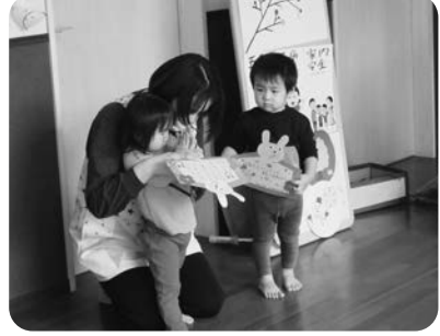
うさぎのモチーフの絵馬

1月12日ちよっぴり早めの小正月行事を行いました。みずき団子作りから枝刺し、絵馬にお願いごとを書いて、みんなで披露しました。前日に団子を作って準備します。みずき団子の4色は、ピンクは春、みどりは夏、黄色は秋、白は冬を表