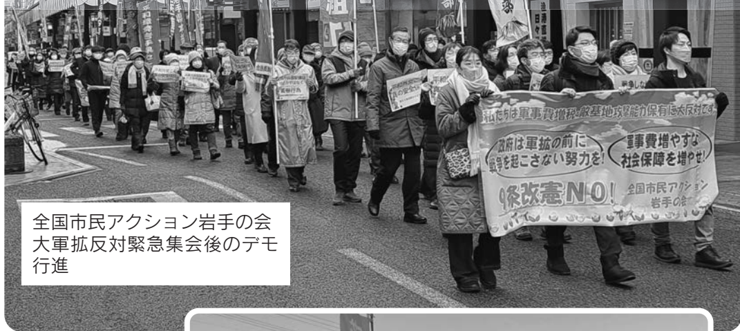
全国市民アクション岩手の会 大軍拡反対緊急集会後のデモ 行進