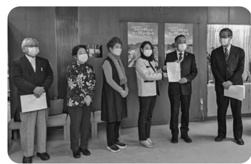
介護保険制度の請願提出

などの保険外し、貸与の福祉用具を購入に変更するなどの見直しを行わないこと、介護従事者を大幅に増やすこと、介護保険財政における国庫負担割合を引き上げることをなどを請願しました。この請願は部分採択となりました。この請願と公明党は反対しました。自民党