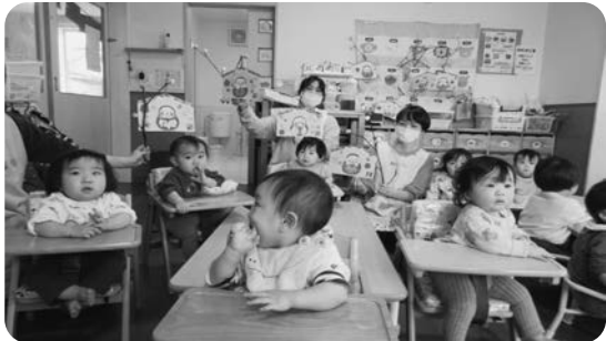
たまご組さん、こっち向いて

し、五穀豊穣や家内安全などの願いが込められています。そのことを子どもたちにお話してから枝に団子を刺します。0歳児もお口に入れそうになりながら、1つ2つ3つと刺します。2歳児になると大きな木にどんどん刺してくれます。新型コロナウイルスの影響で、