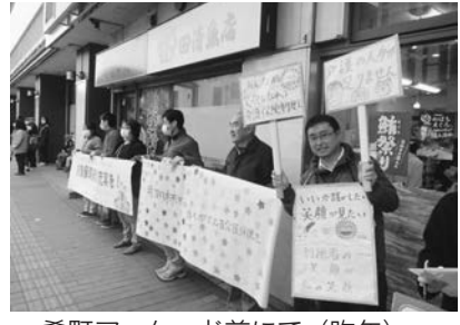
肴町アーケード前にて (昨年)

2021年度は介護報酬改定の年です。介護需要が高まっていく見通しの一方、介護保険創設から20年が経ち、未だ介護報酬は低く据え置かれ、施設運営は困難な状況が続いています。介護現場では慢性的な人手不足や新型コロナウイルスによる影響が、脆弱であった介護事業所に更なる深刻な状況を生み出しています。この状況に即した制