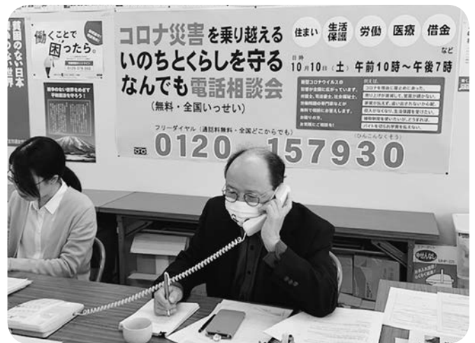
医療生協職員も参加し行われた「いのちの相談所」（10月10日）