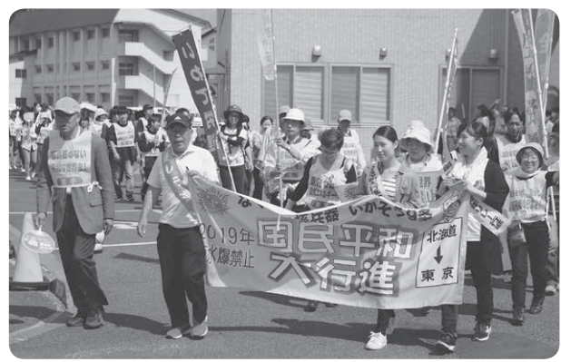
川久保病院から出発する平和行進参加者