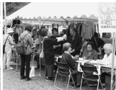
工房フェスタ (岩姫ブロック 9/28・29)