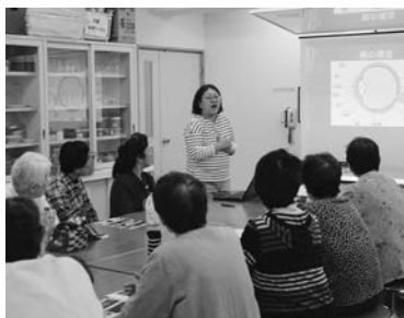
技能訓練士による医療講話 (松園支部ひふみ班 9/19)