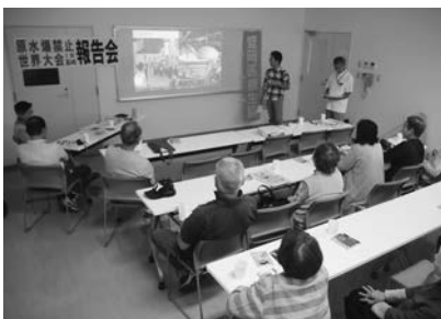
原水爆禁止世界大会参加報告会 (矢巾3支部合同 9/19)