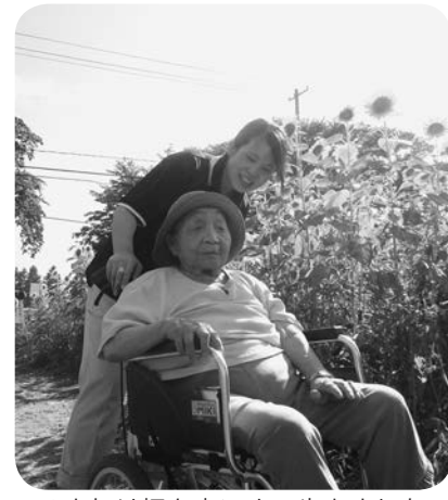
ひまわり畑を車いすで歩きました

着いた先に広がる一面のひまわり畑。背の丈よりも高く伸びたひまわりは、私達を歓迎してくれるようでした。強い日差しに耐えての景色でしたので、みなさんの感動もひとしおです。たくさんの見物客と擦れ違つては「こんにちは」と挨拶をし合い、ひまわり畑を堪能できました。 車に戻り、持ってきていた冷たいお茶を飲んで一息ついた私達は、大きな満足感と、「何もこんな暑い日に行かなくてよかったのでは…」と