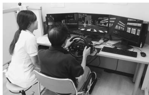
訓練を見守る技士

しかし、病気や怪我などの影響により運転に支障が出る場合があります。川久保病院では運転の再開を希望する方に対して、必要な各種紙面上の検査やドライビングシミュレーターなどの機器を使用した評価を入院患者さんを対象に行い、アドバイスを行っています。運転には「身体」「認知」「精神」と3つの能力が求められ、複合的に評価を行います。また、支援を行う中で「安全な」運転再開が難しいと思われる方もいます。この場合は代替手段の提案や家族の協力が得られるかなどの調整をします。