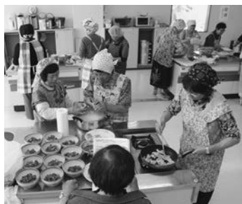
減塩調理実習 (北岩手支部 9/13)