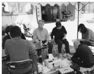
活動センターまつり (厨川みたけ支部 9/27)