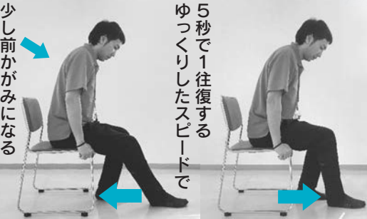
板張りなど滑りの良い板で、前後20cm位滑らせる